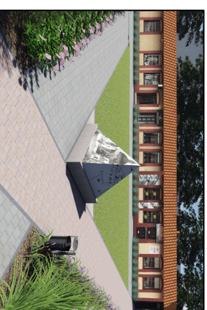
Podświetlona tablica informacyjna w kształcie ostrosłupu trójkątnego, ścianki z trzech stron wykonane z pleksi z nadrukiem, rama metalowa