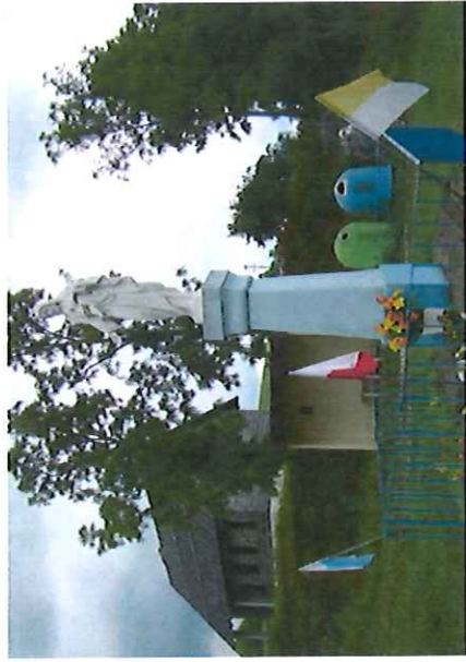
Figura w Zieleniu