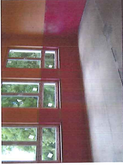
Budynek po byłej szkole podstawowej w Zieleniu