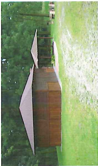
Były młyn w Zieleniu