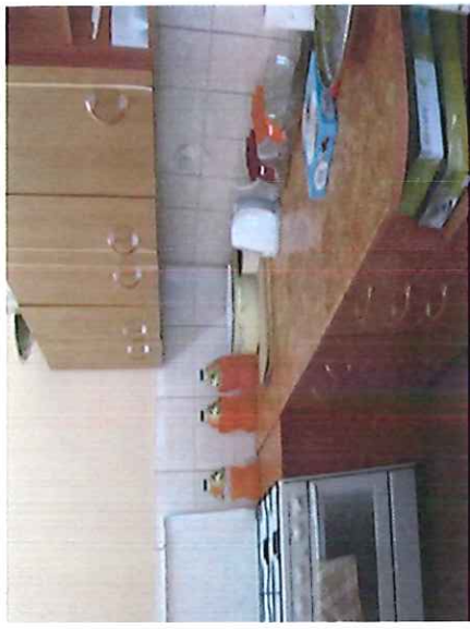
Świetlica wiejska z Zieleniu