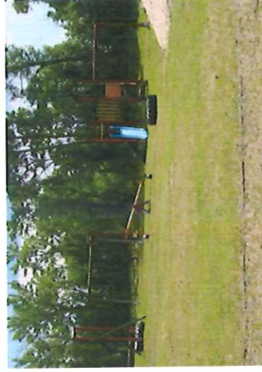
Plac zabaw oraz boisko na placu po byłej szkole podstawowej