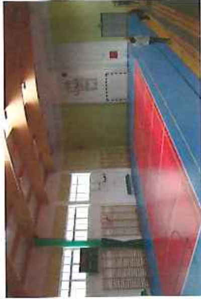
Nowoczesna hala sportowa przy szkole