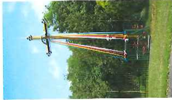
Pamiętkowe krzyże i kapteluszki