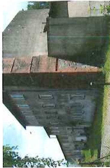
Budynek po byłej gorzelni