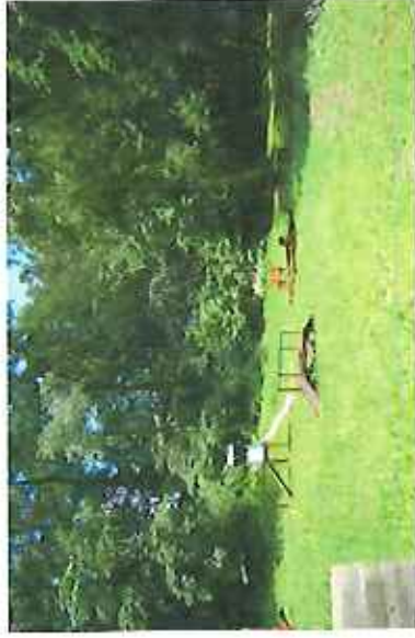
Plac zabaw dla dzieci