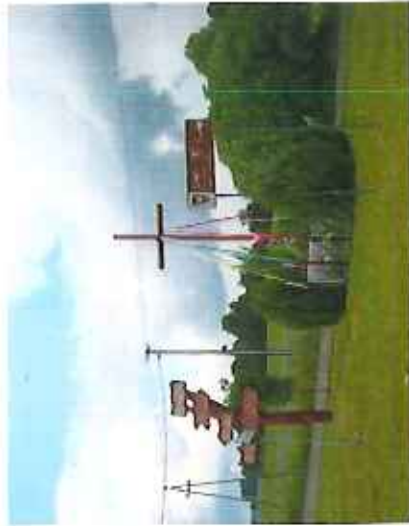
Krzyż i oznakowanie w Kruchowie