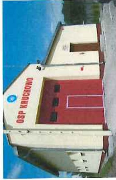
Budynek OSP Kruchowo