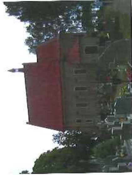
Kościół i cmentarz parafialny