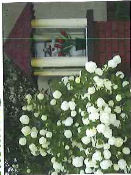
Kapliczka na Ignalinie