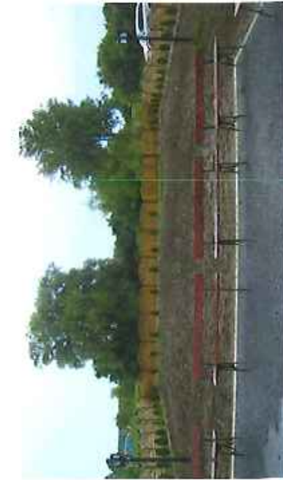
Plac za świetlicą