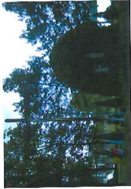
Krzyż i figura przy kościele