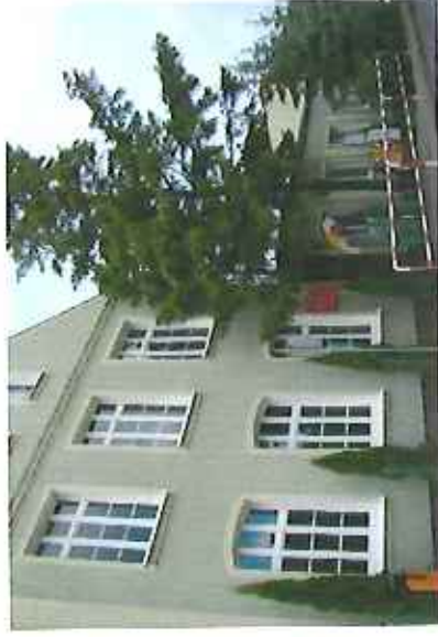
Szkoła Podstawowa w Kruchowie