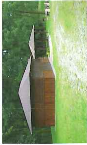
Były młyn w Zieleniu