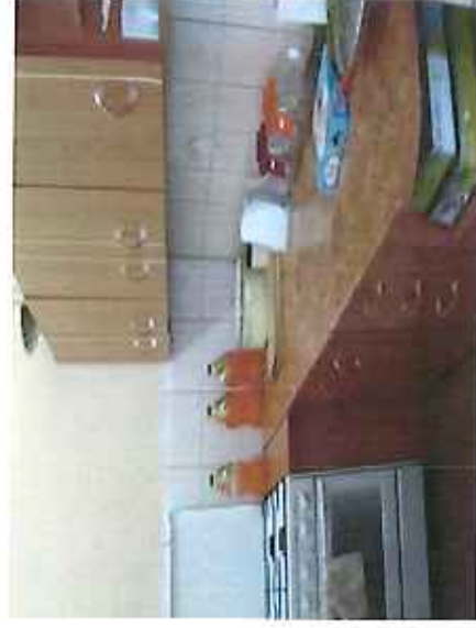
Świetlica wiejska z Zieleniu