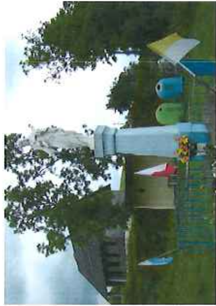
Figura w Zieleniu