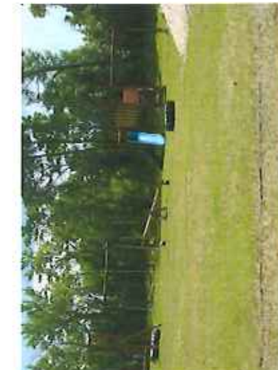
Plac zabaw oraz boisko na placu po byłej szkole podstawowej