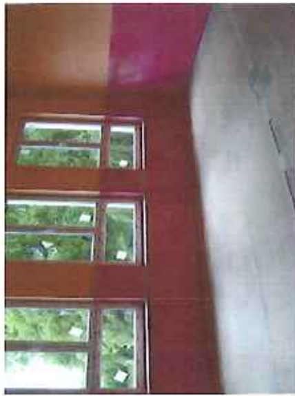
Budynek po byłej szkole podstawowej w Zieleniu