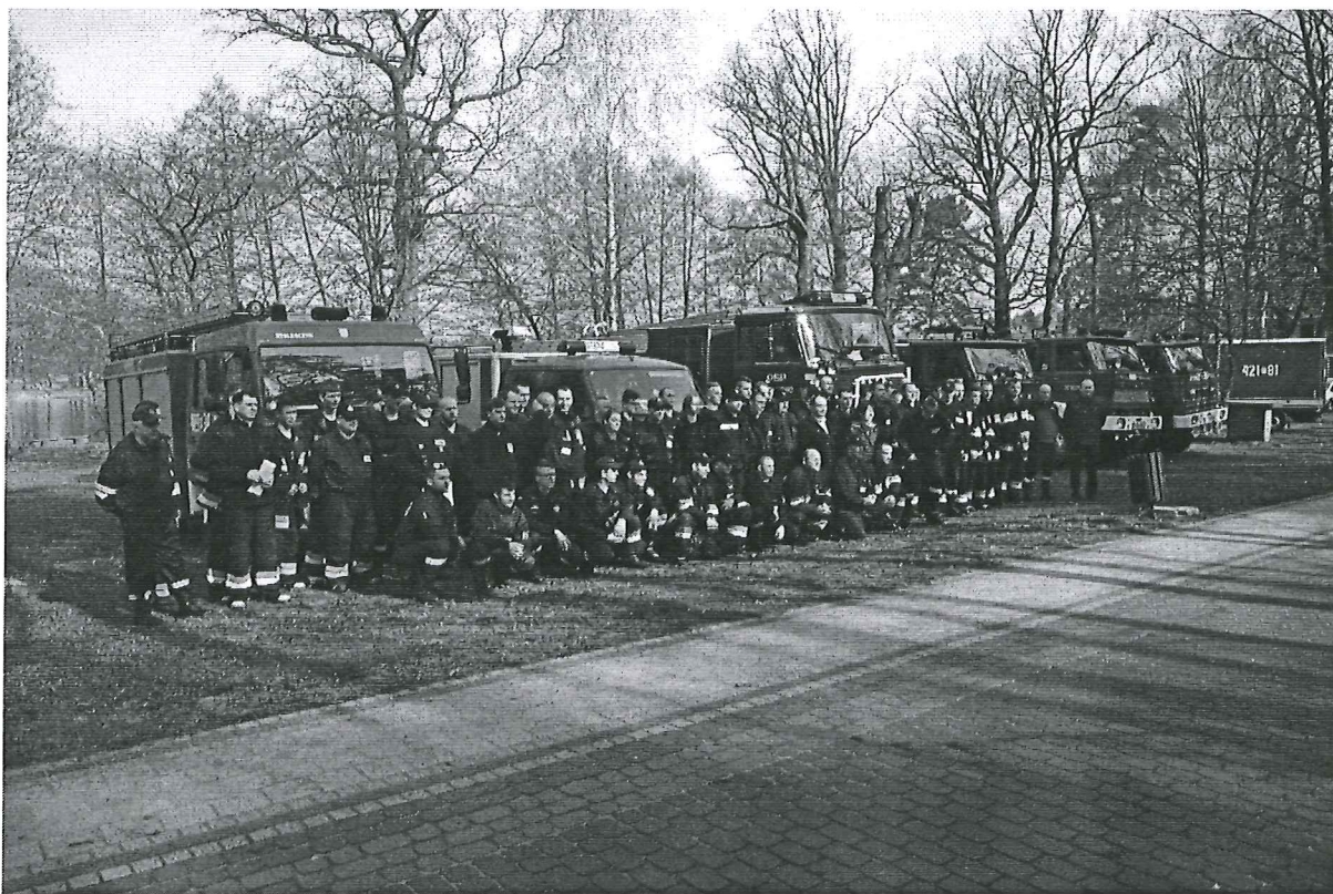
Foto. 6 . 16 kwietnia 2017, III – warsztaty i ćwiczenia „Integracja” w Skorzęcinie z udziałem OSP Kruchowo.