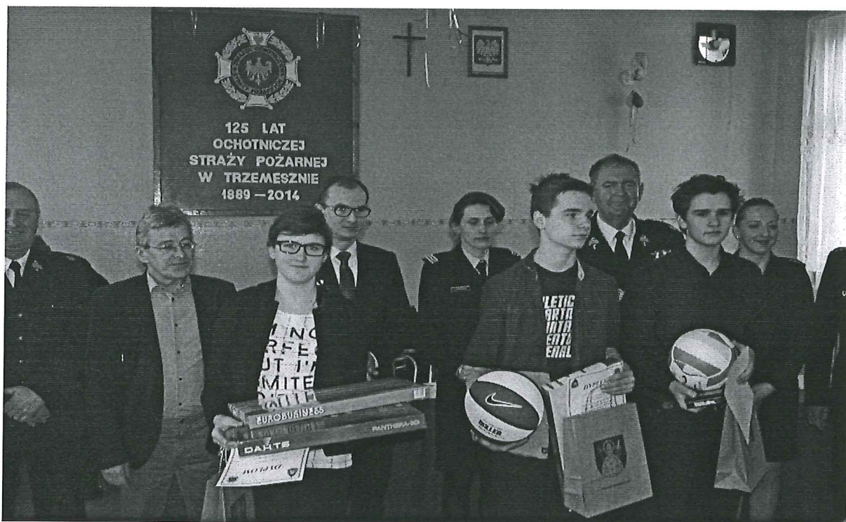
Foto. 11. Powiatowe eliminacje turnieju wiedzy pożarniczej w Trzemesznie – 2016 r.