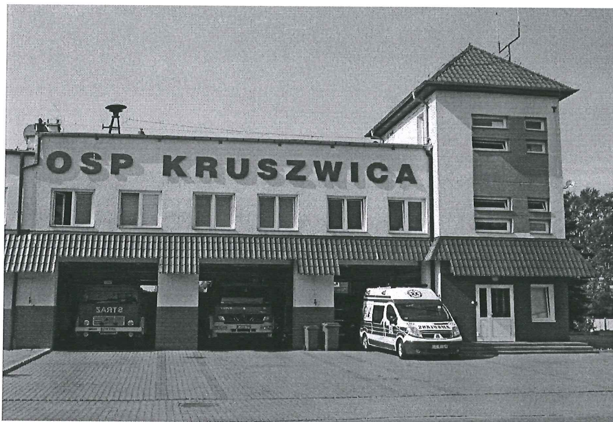
Foto 14. i 15. Siedziba Komisariatu Policji, OSP i Zespołu Ratownictwa Medycznego w Kruszwicy, powiat inowrocławski, województwo kujawsko-pomorskie. Na zdjęciu są niewidoczne samochód terenowy i łódź ratownicza.