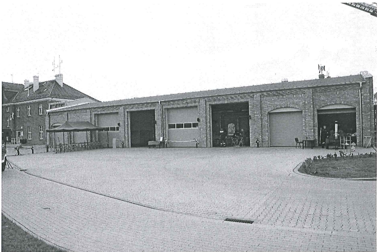
Foto. 18. Swarzędzkie Centrum Ratownicze w Swarzędzu, powiat poznański, województwo wielkopolskie, znajdujące się w dawnym budynku dworca kolejowego. W dobudowanym kompleksie garażowym znajdują się od lewej: 2 garaże Zespołów Ratownictwa Medycznego, 4 garaże dla OSP i 2 garaże Straży Miejskiej.