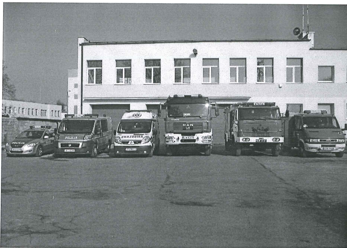
Foto. 16. Rozbudowana siedziba OSP w Gniewkowie, powiat inowrocławski, województwo kujawsko-pomorskie mieszcząca Komisariat Policji, OSP i Zespół Ratownictwa Medycznego .