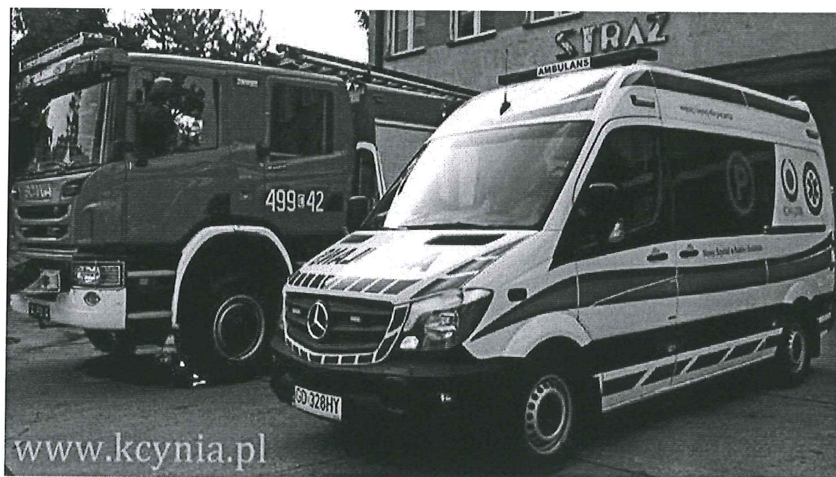
Foto. 17. Wspólna siedziba OSP i Zespołu Ratownictwa Medycznego w Kcyni, powiat nakielski, województwo kujawsko-pomorskie. .Foto: www.kcynia.pl