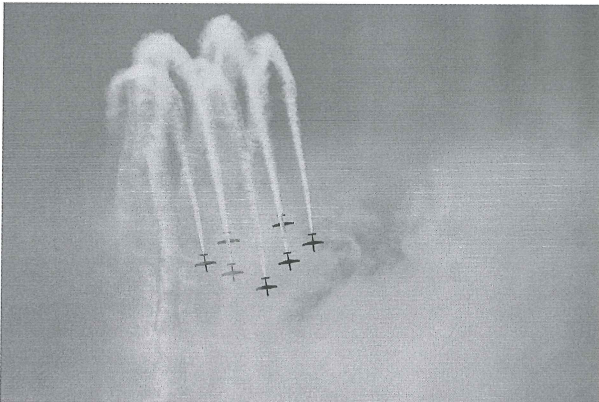
Foto. 9. Zabezpieczane m.in. przez OSP Trzemeszno pokazy lotnicze w 33. BLTr w Powidzu – 01.06.2016 r.