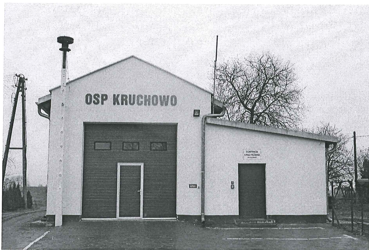
Foto. 12. Zmodernizowana remiza OSP w Kruchowie.