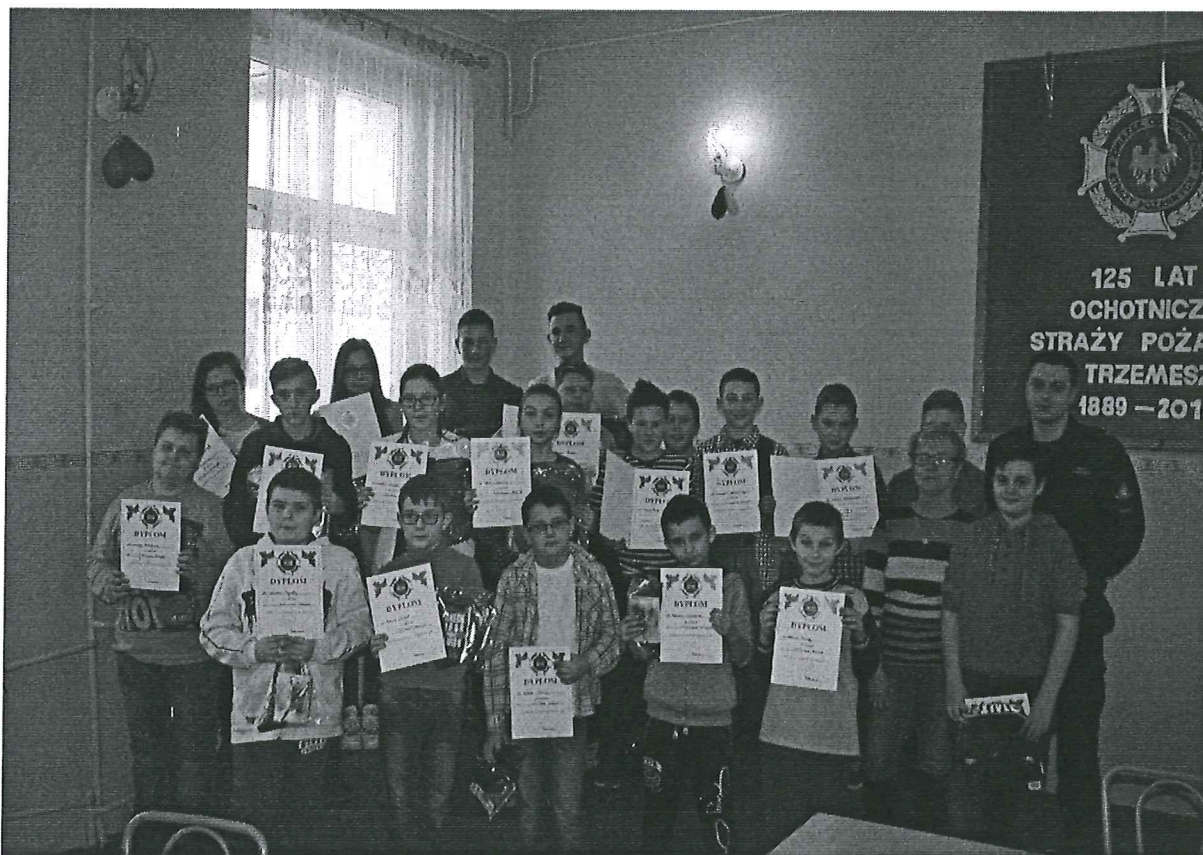
Foto. 10. . Gminne Eliminacje Ogólnopolskiego Turnieju Wiedzy Pożarniczej w Trzemesznie, 13 marca 2016 r.