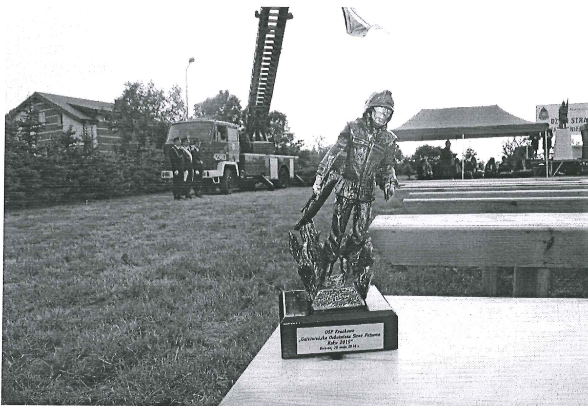
Foto. 4. Pamiątkowa statuetka dla OSP w Kruchowie.