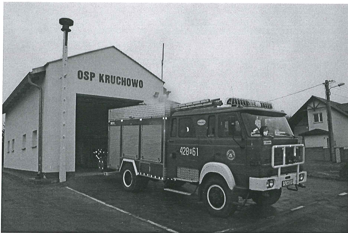
Foto. 13. Remiza i wóz bojowy OSP Kruchowo, Foto. Piotr Dzięcielak.