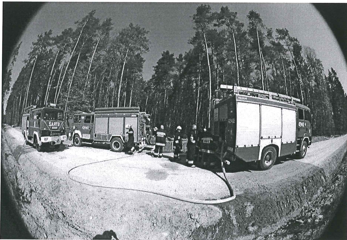
Foto. 5. Ćwiczenia taktyczno- bojowe „Krzyżówka 2016”, na terenie gminy Witkowo, Foto Marian Guziałek.