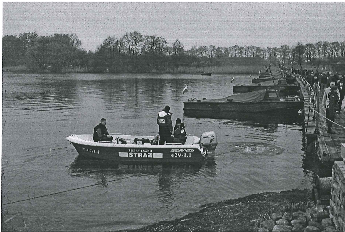
Foto 7 . Zabezpieczenie przez OSP Trzemeszno i PSP Piła obchodów 1050. rocznicy Chrztu Polski na Ostrowie Lednickim.. -9-