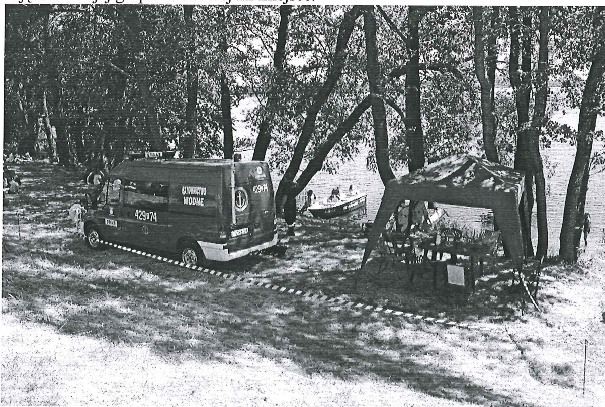
Foto. 8. Posterunek OSP Trzemeszno podczas Lednicy 2000, gdzie strażacy z Trzemeszna współpracują z policyjną łodzią patrolową KPP w Gnieźnie.