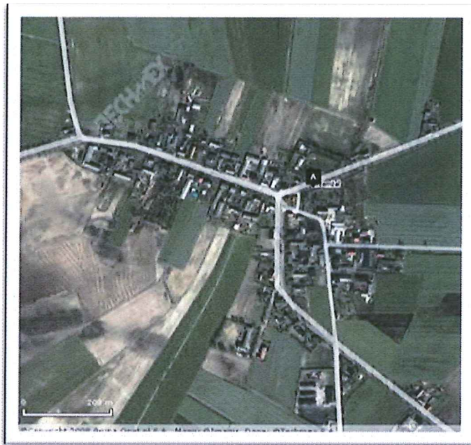
Trzemżał na mapie

Miejscowość Trzemżał położona jest na pojezierzu gnieźnieńskim w południowo-wschodniej części woj. wielkopolskiego, pow. gnieźnieńskim i w gm. Trzemeszno i sąsiaduje z Mijanowem, Popielewem, Zieleniem, Ostrowitem, Miławą, Kamieńcem i Szydłowem. Miejscowość leży na wysokości 100 m n.p.m. w równinnym, bezleśnym terenie.