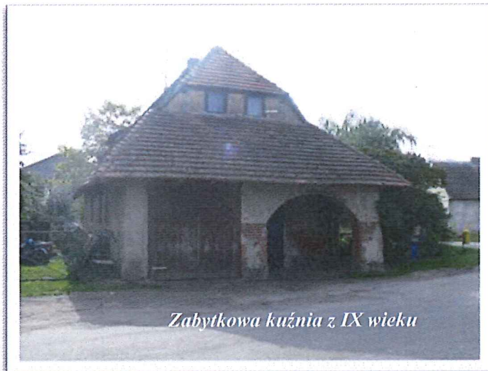
Zabytkowa kuźnia z IX wieku

przedmiotem kolonizacji i germanizacji. W 1895 roku pruska Komisja Kolonialna wykupiła majątek Trzemżal i rozparcelowała go. W tym okresie połowę ludności wsi