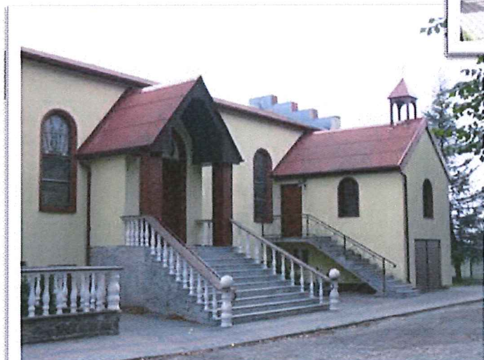
Kościół parafialny w Trzemżalu p.w. Józefa Rzemieślnika