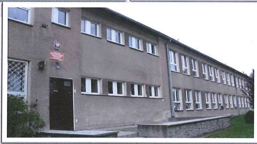
Zespół Szkół w Trzemżalu

W Trzemżalu zamieszkują 330 osoby. Gęstość zaludnienia wynosi 29 osób/km 2 . We wsi znajduje się 50 gospodarstw rolnych.