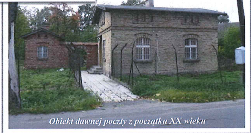
Obiekt dawnej poczty z początku XX wieku

stanowili Niemcy. Pozostałością tamtego okresu jest między innymi stary gmach szkoły niemieckiej z 1901 roku, a w latach 20 – tych naszego ubiegłego wieku zrodziła się myśl pobudowania