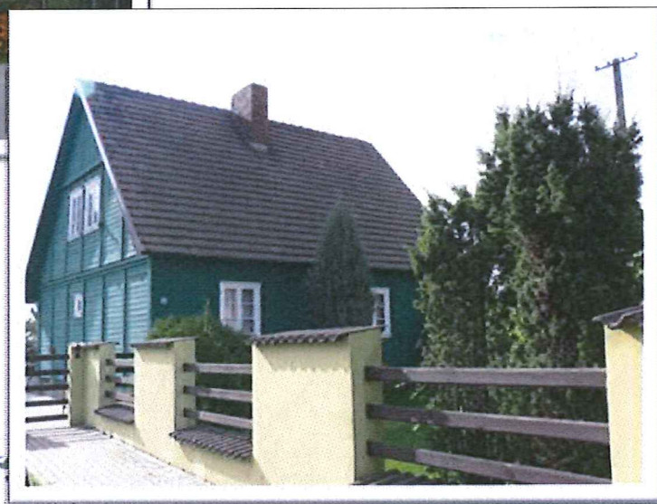
Stara, drewniana XIX wieczna architektura wsi