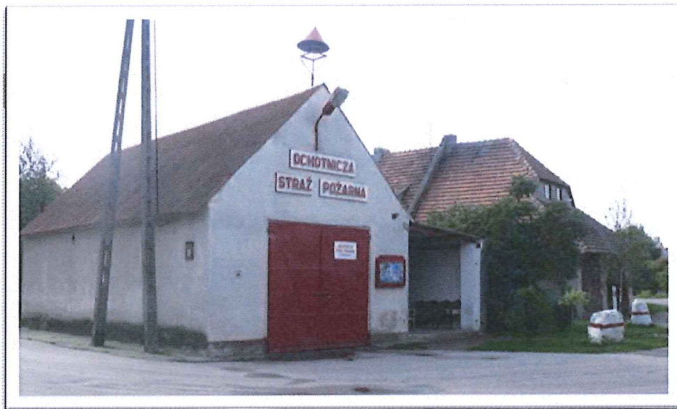
Stacja Ochotniczej Straży Pożarnej

Trzemzał ma również swoją jednostkę Ochotniczej Straży Pożarnej OSP Trzemzał o bardzo bogatej ponad 85 letniej historii.