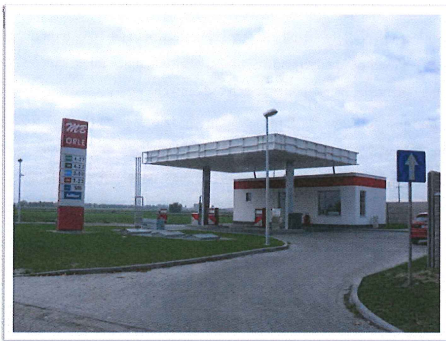
Nowo wybudowana stacja paliw

Jednocześnie z reguły małe i średnie firmy są predysponowane do wykorzystania nie użytkowanych do tej pory terenów produkcyjnych, zagospodarowania wolnych obiektów gospodarczych oraz do działań na terenach przekształcających się w kierunku ogólnie pojętej aktywizacji gospodarczej.