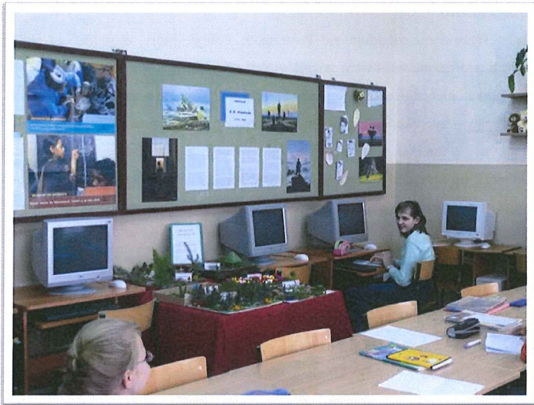
Szkoła w Trzemeszno