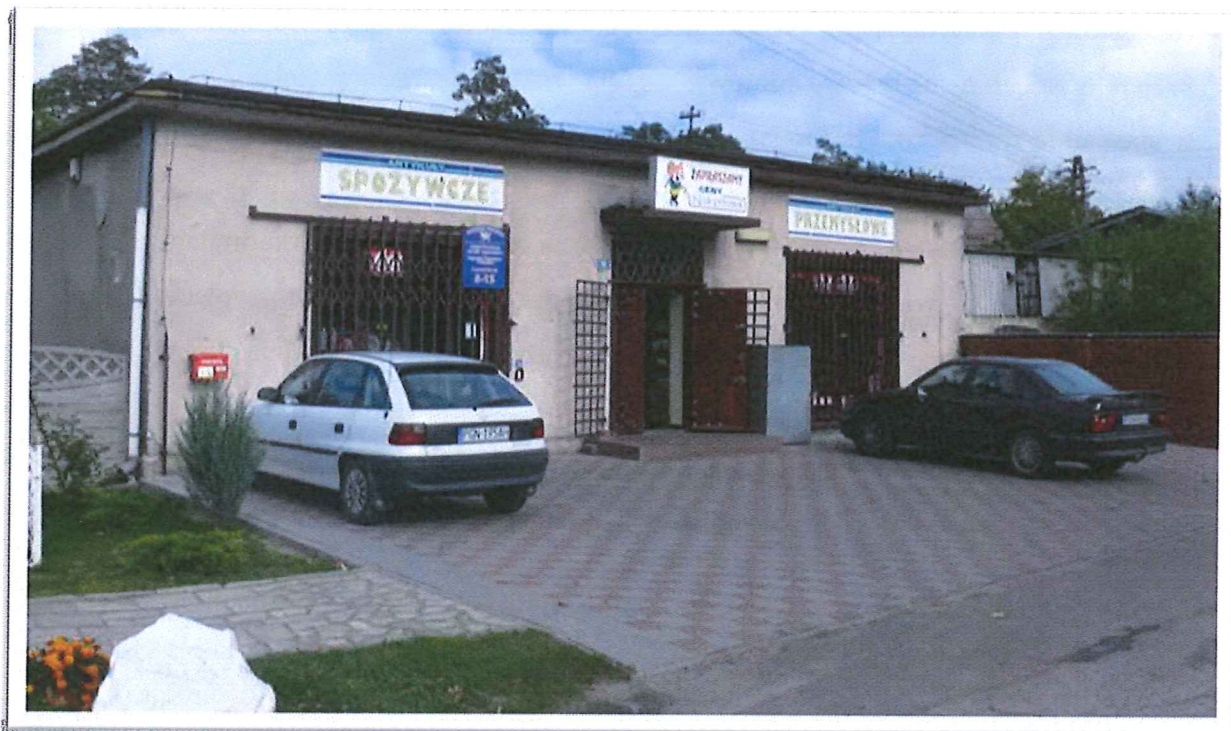
Sklep spożywczy z oddziałem poczty

Stopień telefonizacji przewodowej miejscowości Trzemżał osiągnął wysoki poziom, co oznacza pełne zaspokojenie lokalnych potrzeb. Ostatnio jednak nastąpiła tendencja do rezygnacji z telefonów stacjonarnych, które spowodowane są wysokim abonamentem telekomunikacji.