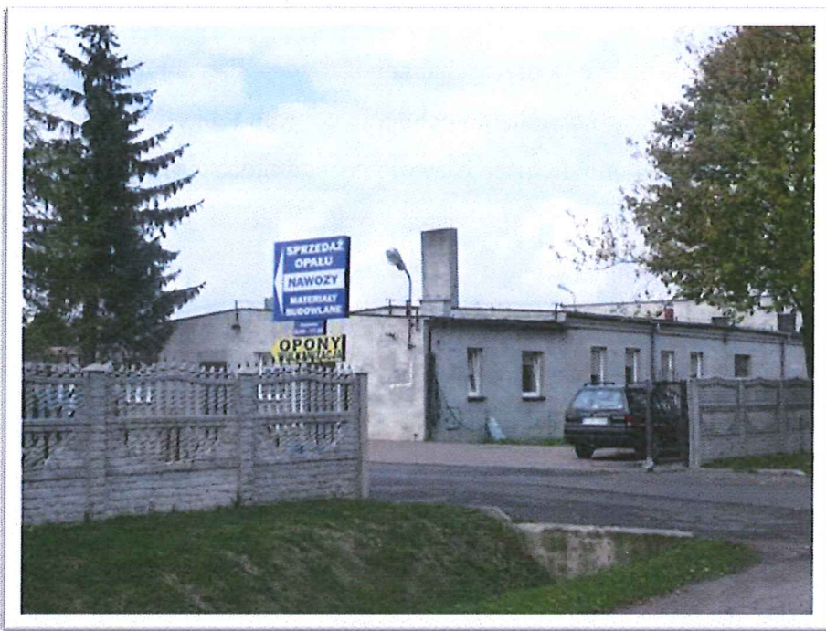
W miejsce dawnej bazy Zakładu Usług Mechanizacyjnych powstało kilka mniejszych zakładów usługowych.

Jednocześnie z reguły małe i średnie firmy są predysponowane do wykorzystania nie użytkowanych do tej pory terenów produkcyjnych, zagospodarowania wolnych obiektów gospodarczych oraz do działań na terenach przekształcających się w kierunku ogólnie pojętej aktywizacji gospodarczej.