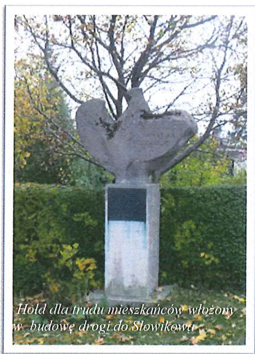
Hold dla trudu mieszkańców włożony w budowę drogi do Słowikowa

W Trzemzalu znajduje się kilka obiektów zabytkowych. Są to: kuźnia z XIX wieku, budynek poczty z początków XX wieku, Dom Pań. ST. IO Cz. Paluch z XIX oraz 2 budynki szkolne z XIX w. Przy skrzyżowaniu dróg Orchowo-Ostrowite (przy posesji Pań. Menclewiczów) znajduje się obelisk, który upamiętnia pobudowanie drogi do wsi Ostrowite z okazji 1000-lecia Państwa Polskiego.