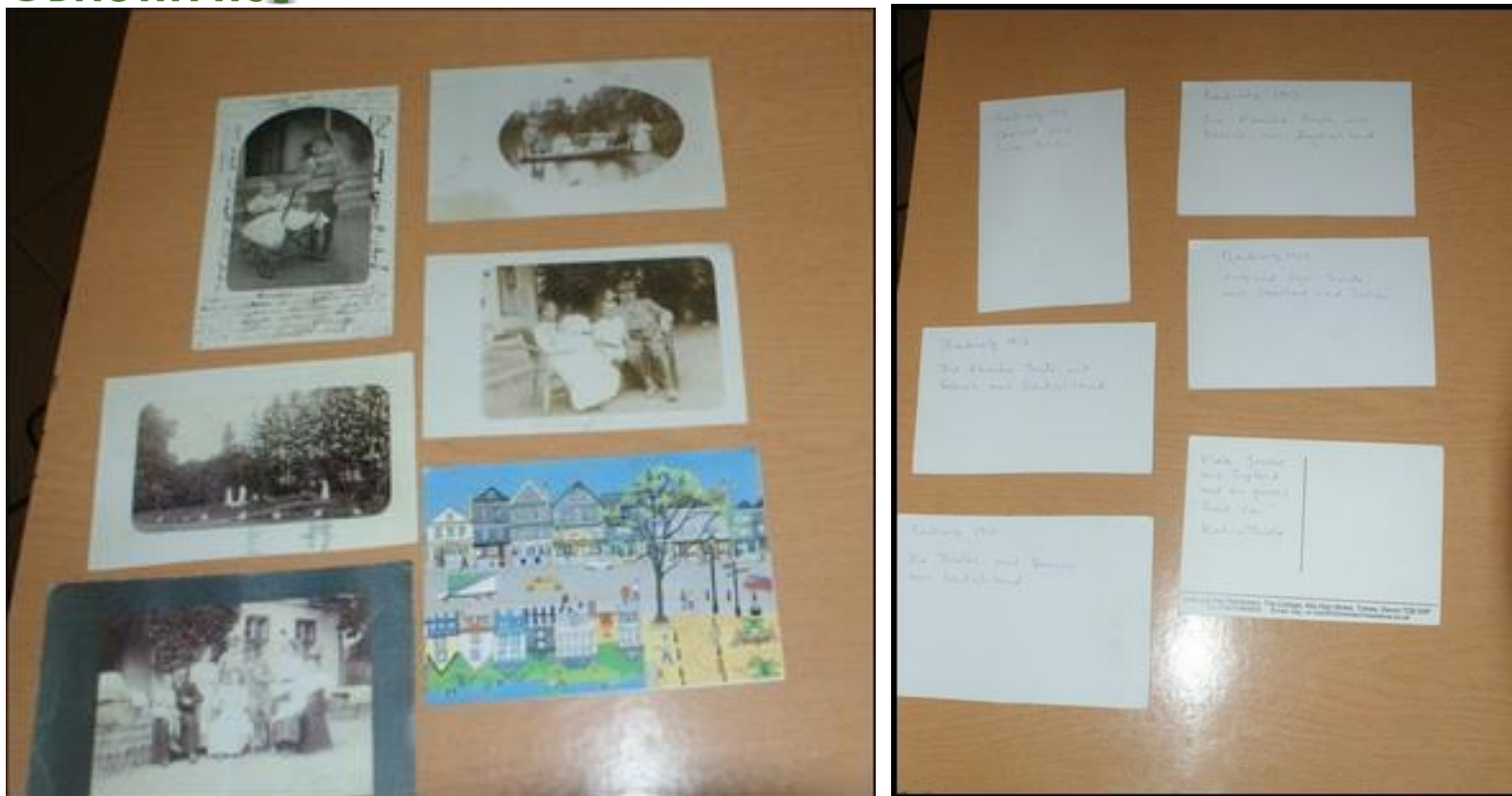
Pocztówki okresu międzywojennego z prywatnego archiwum Soltysa