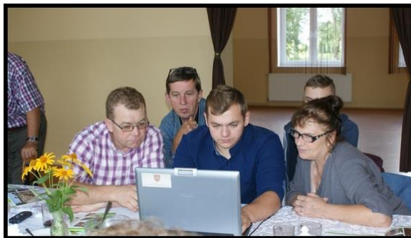
Grupa Odnowy Wsi w czasie warsztatów opracowania Sołeckiej Strategii Rozwoju.

Świetlica Wiejska w Ławkach 5.IX.2016 r., Świetlica Wiejska w Wydartowie 6.IX.2016 r.