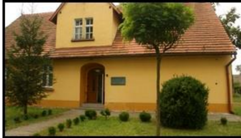
Świetlica Wiejska w Ławkach im. Hipolita Cegielskiego