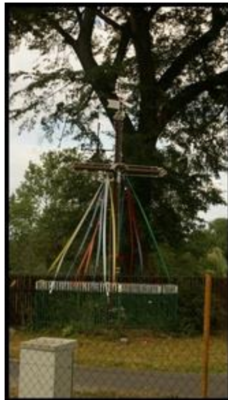
Przydrożny krzyż odnowiony w ramach pracy własnej Sołtysa i mieszkańców