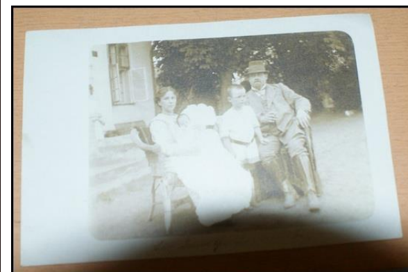
Pocztówki z okresu międzywojennego