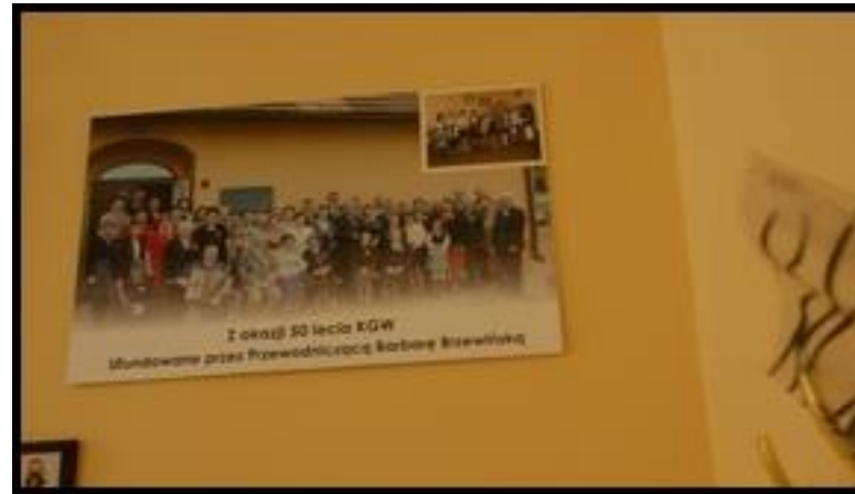
Pamiętki po obchodach 50- lecia KGW znajdujące się w świetlicy wiejskiej