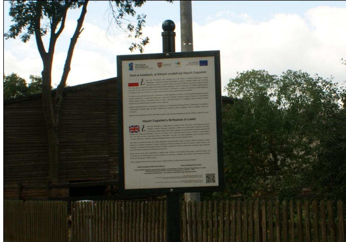
Tablica pamiątkowa i informacyjna o Hipolicie Cegielskim