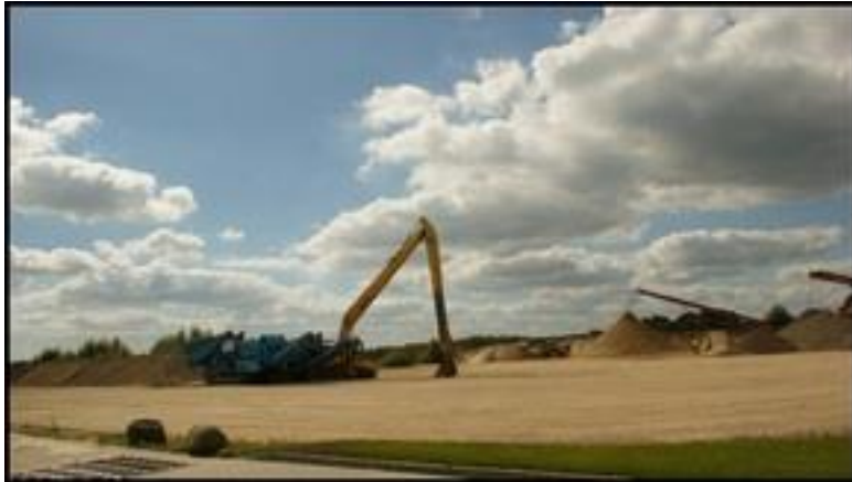
Żwirownia w Ławkach