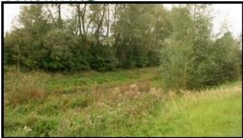
Staw – obecnie wyschnięty