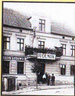
Siedziba Banku Ludowego „ROLNIK” przy pl. 4 Kłobuckiego w Trzemesznie ok. 1925 r.