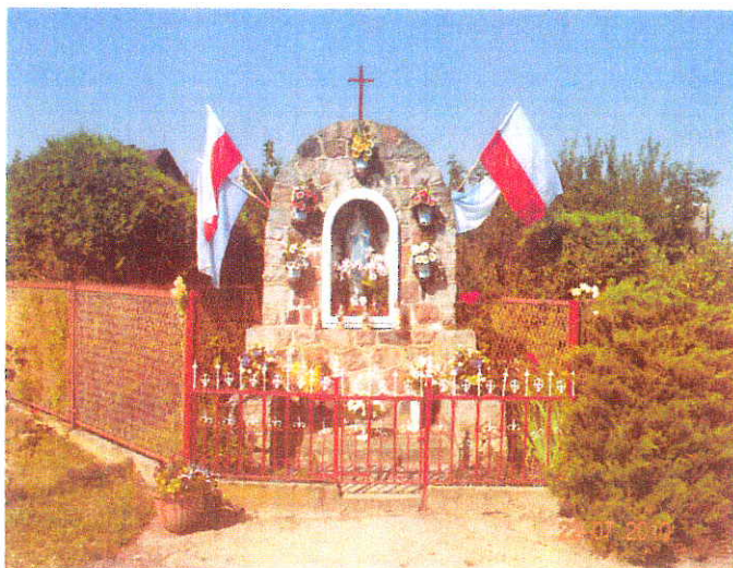
W centrum wsi znajduje się "grota" z figurą Matki Boskiej.

W Miławie nie ma kościoła, mieszkańcy należą do parafii Kamienieckiej. Cechą charakterystyczną są trzy miejsca kultu religijnego w postaci przydrożnych figur.