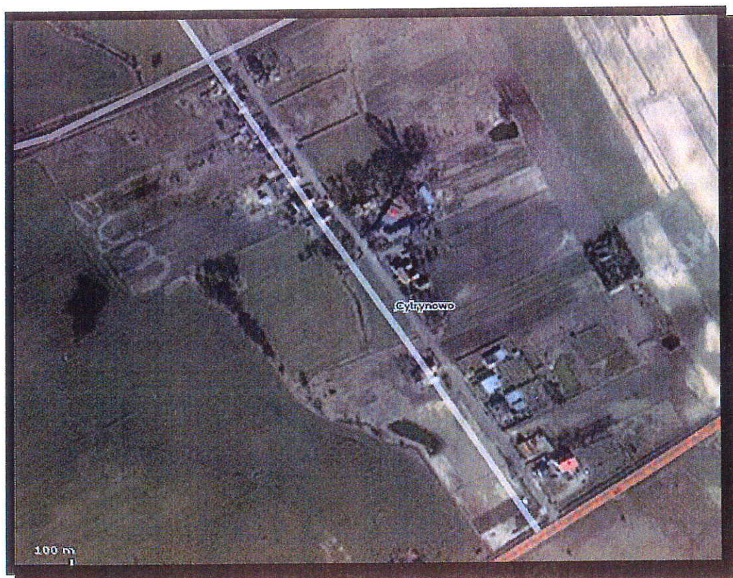
Rys. 1. Sołectwo Cytrynowo.

Sołectwo Cytrynowo położone jest na terenie województwa wielkopolskiego, w powiecie gnieźnieńskim, w gminie Trzemeszno. Składa się z trzech miejscowości: wsi soleckiej Cytrynowo oraz osad Bystrzyca i Kocin. Należy do grupy mniejszych sołectw na terenie gminy Trzemeszno. Położone jest w centralnej części gminy i graniczy z: Trzemesznem, Niewolnem, Dusznem, Wydartowem, Lubiniem, Popielewem i Zieleniem.