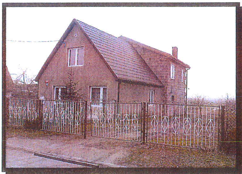
Rys. 4 Zagroda gospodarza wsi.