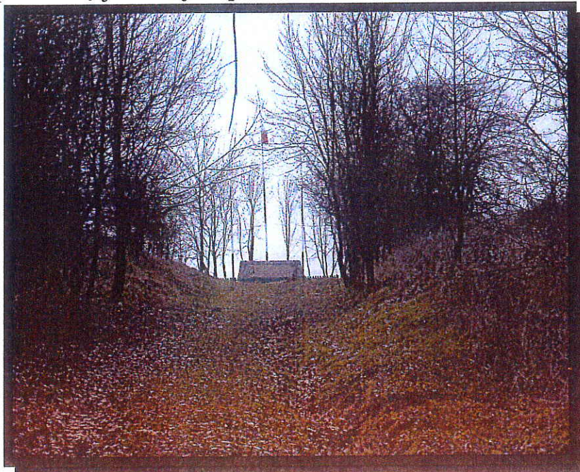
Rys. 2 Wąwóz prowadzący do miejsca pamięci narodowej.

Za Cytrynowem na szczycie wzgórza, do którego prowadzi wąwóz znajduje się miejsce pamięci narodowej, w którym jesienią 1939 roku hitlerowcy rozstrzelali kilkudziesięciu Polaków z Trzemeszna i okolicy. Kiedyś istniał tu przysiółek o nazwie Kociń od nazwy znajdującego się w pobliżu jeziora, jednak obecnie nie ma tu żadnych zabudowań.