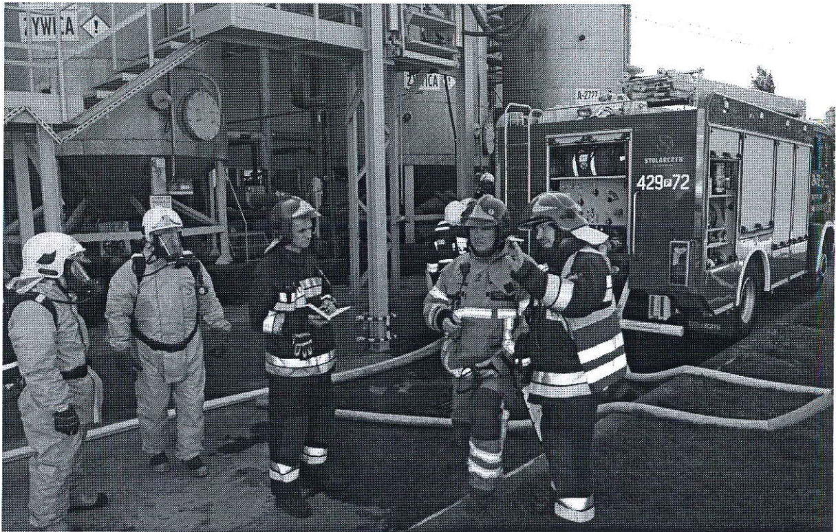
Foto. 12. Ćwiczenia z zakresu ratownictwa chemicznego (szczebla wojewódzkiego) na terenie zakładu Prefere Resins Poland Sp. z o.o..