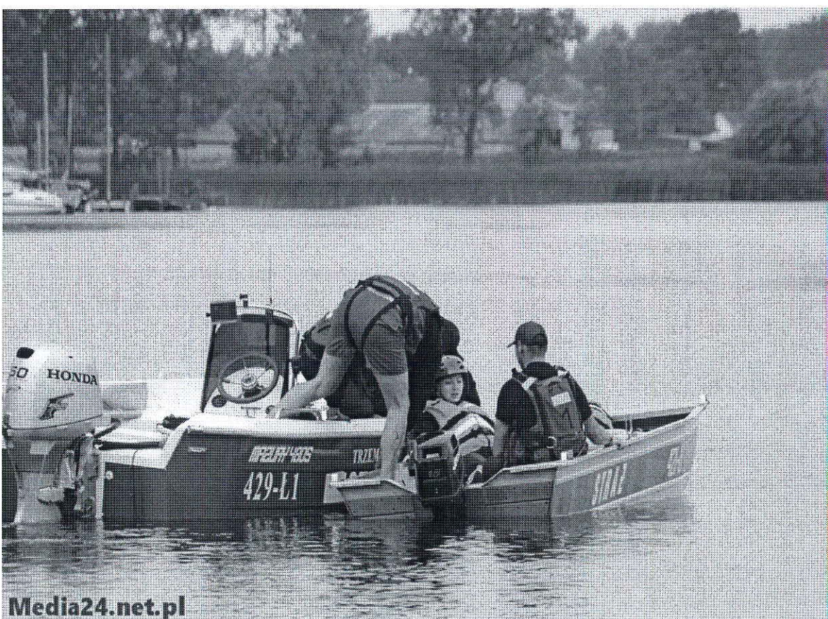
Foto. 10 i 11. Szkolenie z zakresu ratownictwa wodnego na akwenu w Kłęcku – lato 2015 z udziałem Sekcji Ratownictwa Wodnego OSP Trzemeszno.