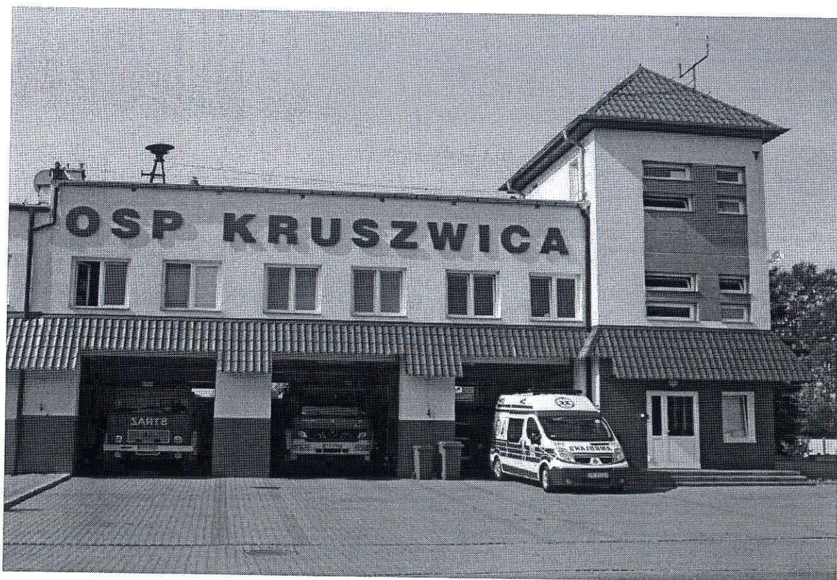
Foto 14. i 15. Siedziba Komisariatu Policji, OSP i Zespołu Ratownictwa Medycznego w Kruszwicy, powiat inowrocławski, województwo kujawsko-pomorskie. Niewidoczne na zdjęciu samochód terenowy i łódź ratownicza.