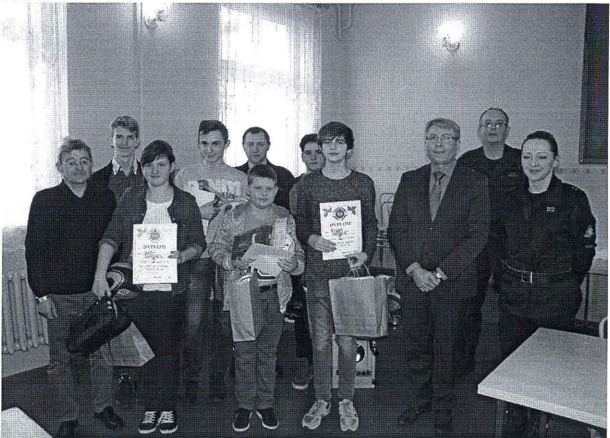
Foto.6 i 7 . Gminne Eliminacje Ogólnopolskiego Turnieju Wiedzy Pożarniczej w Trzemesznie, 13 marca 2015 r.