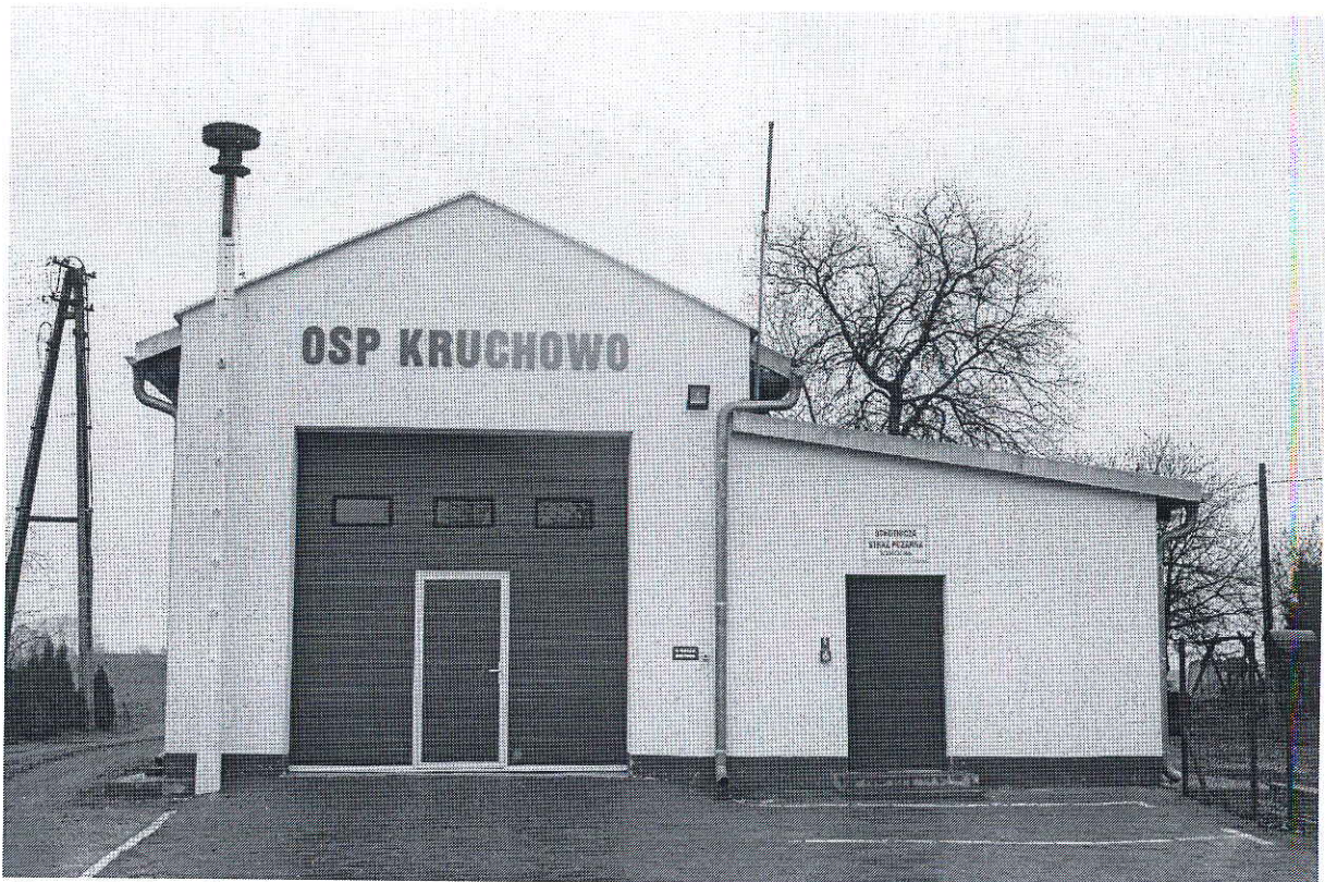
Foto. 8. Zmodernizowana remiza OSP w Kruchowie. Wzorcowy obiekt tego typu na terenie powiatu gnieźnieńskiego i powiatów ościennych.