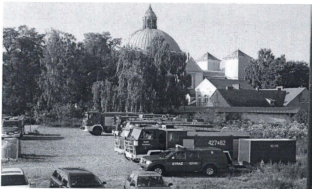
Foto. 5 Zgrupowanie jednostek strażackich przed ćwiczeniami na terenie Prefere Resins Poland Sp. z o.o. w Trzemesznie – parking przy ul. Tumskiej, wrzesień 2015.