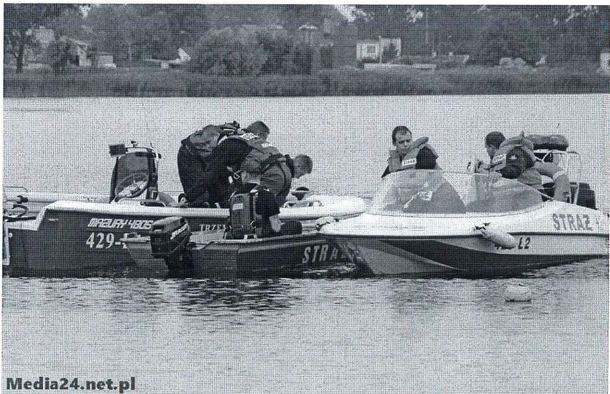
Foto 13. Doskonalenie umiejętności z zakresu ratownictwa wodnego w Kłęcku od lewej łodzi ratowniczej OSP Trzemeszno, PSP Gniezno i OSP Witkowo.