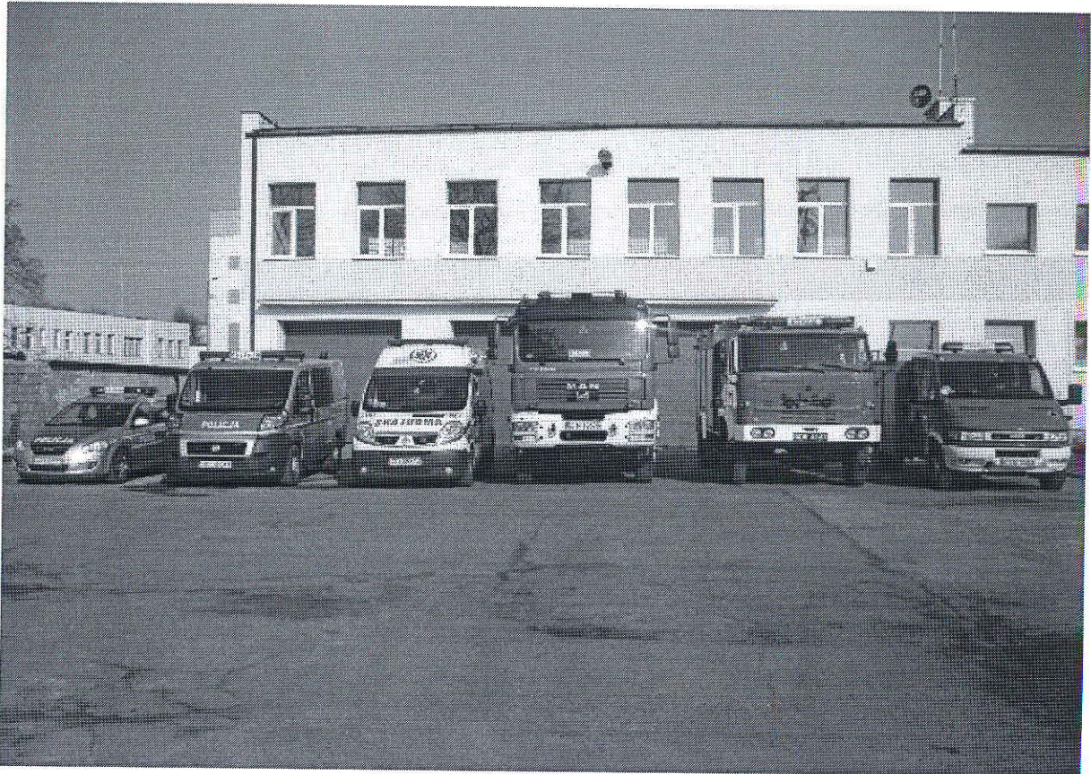
Foto. 16. Rozbudowana siedziba OSP w Gniewkowie, powiat inowrocławski, województwo kujawsko-pomorskie mieszcząca Komisariat Policji, OSP i Zespół Ratownictwa Medycznego . Foto. Internet.