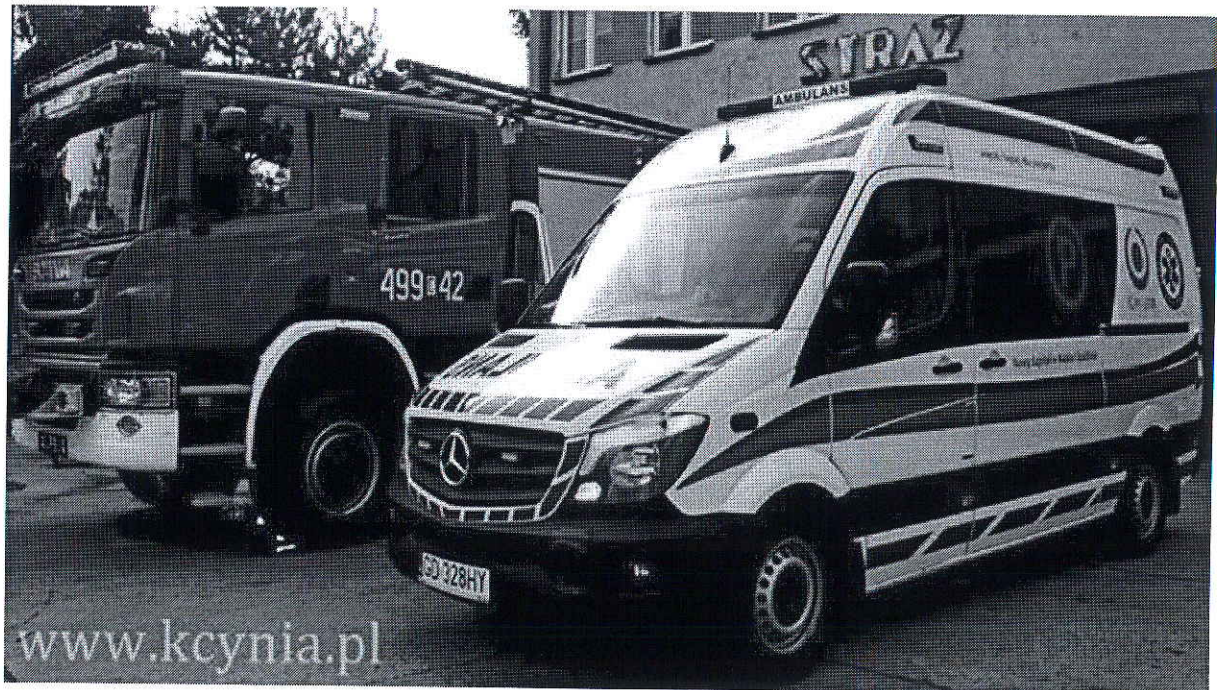
Foto. 17. Wspólna siedziba OSP i Zespołu Ratownictwa Medycznego w Kcyni, powiat nakielski, województwo kujawsko-pomorskie. .Foto: www.kcynia.pl