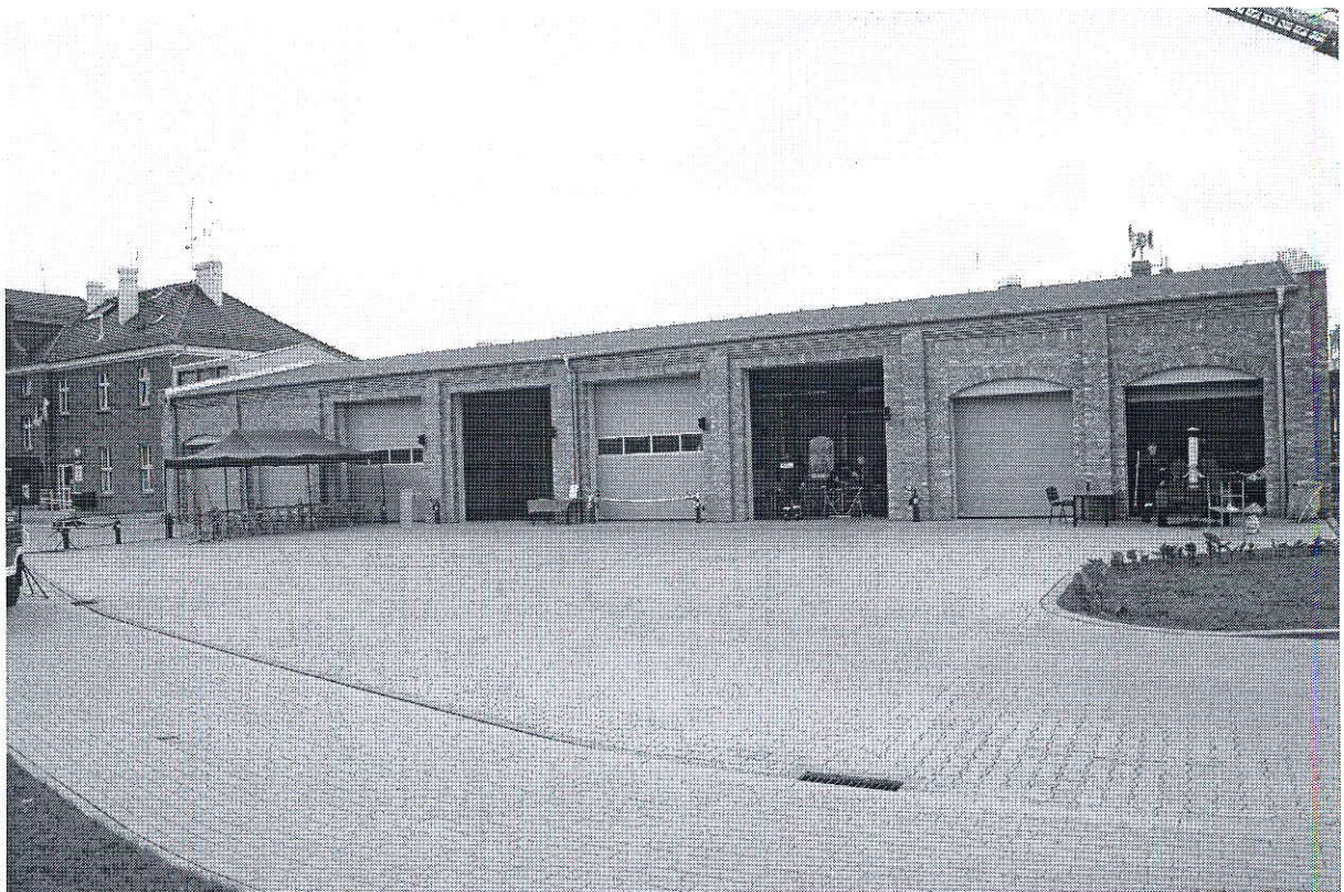
Foto. 18. Swarzędzkie Centrum Ratownicze w Swarzędzu, powiat poznański, województwo wielkopolskie, znajdujące się w dawnym budynku dworca kolejowego. W dobudowanym kompleksie garażowym znajdują się od lewej: 2 garaże Zespołów Ratownictwa Medycznego, 4 garaże dla OSP i 2 garaże Straży Miejskiej.