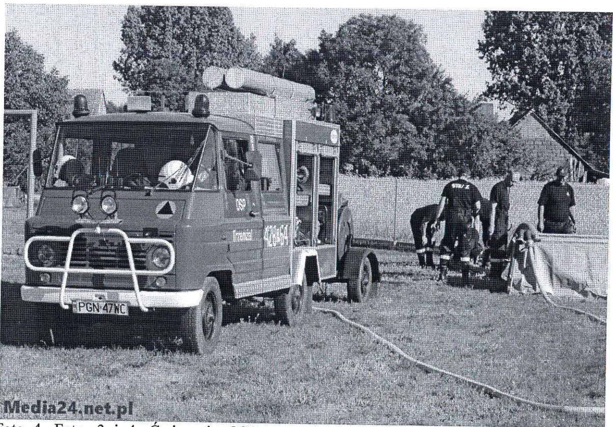
Foto 4. Foto. 3 i 4. Ćwiczenia OSP z terenu Gminy Trzemeszno na terenie sołectwa Wymysłowo, czerwiec 2015.