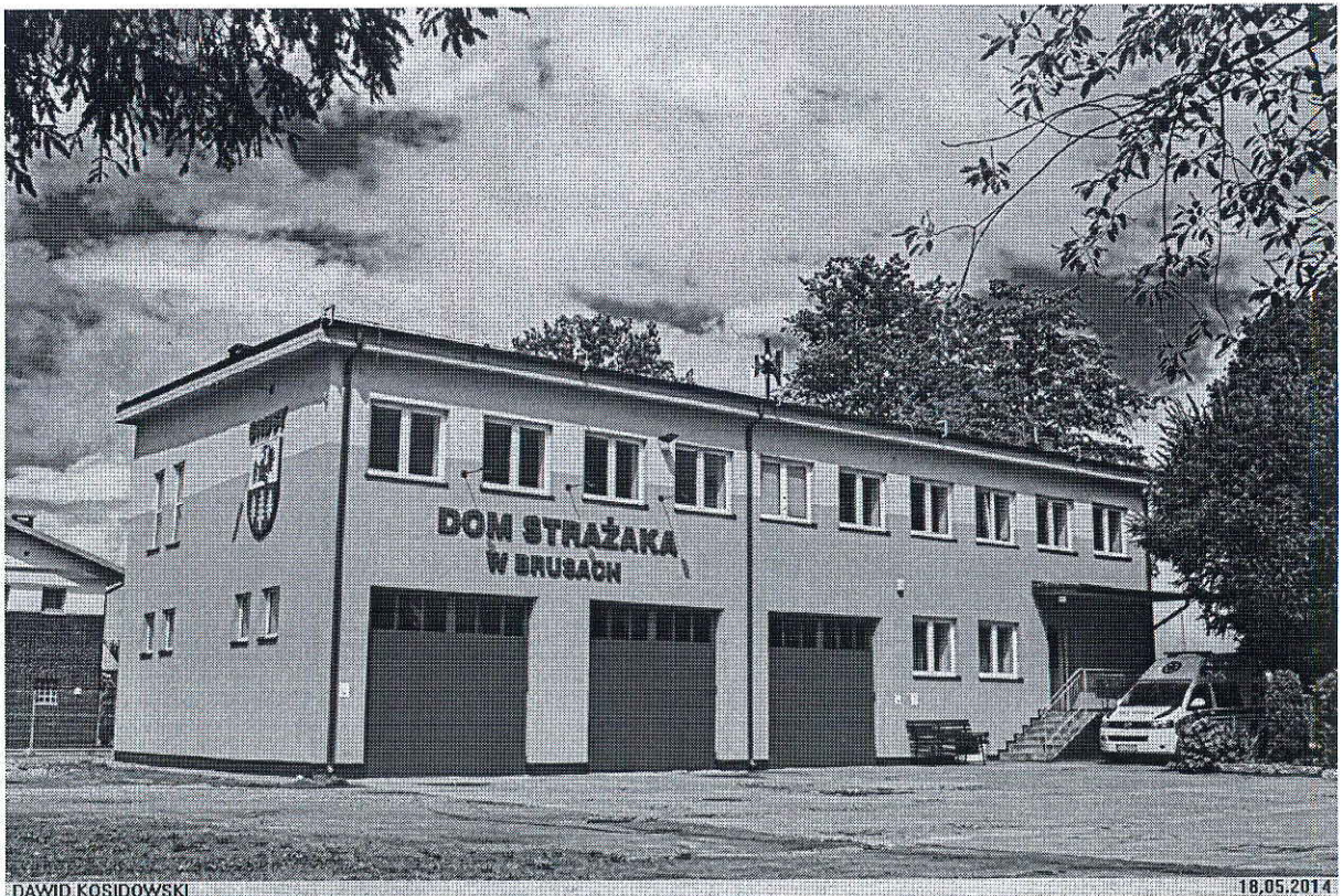
Foto. 19. Siedziba OSP i Zespołu Ratownictwa Medycznego w Brusach, powiat chojnicki, województwo pomorskie.