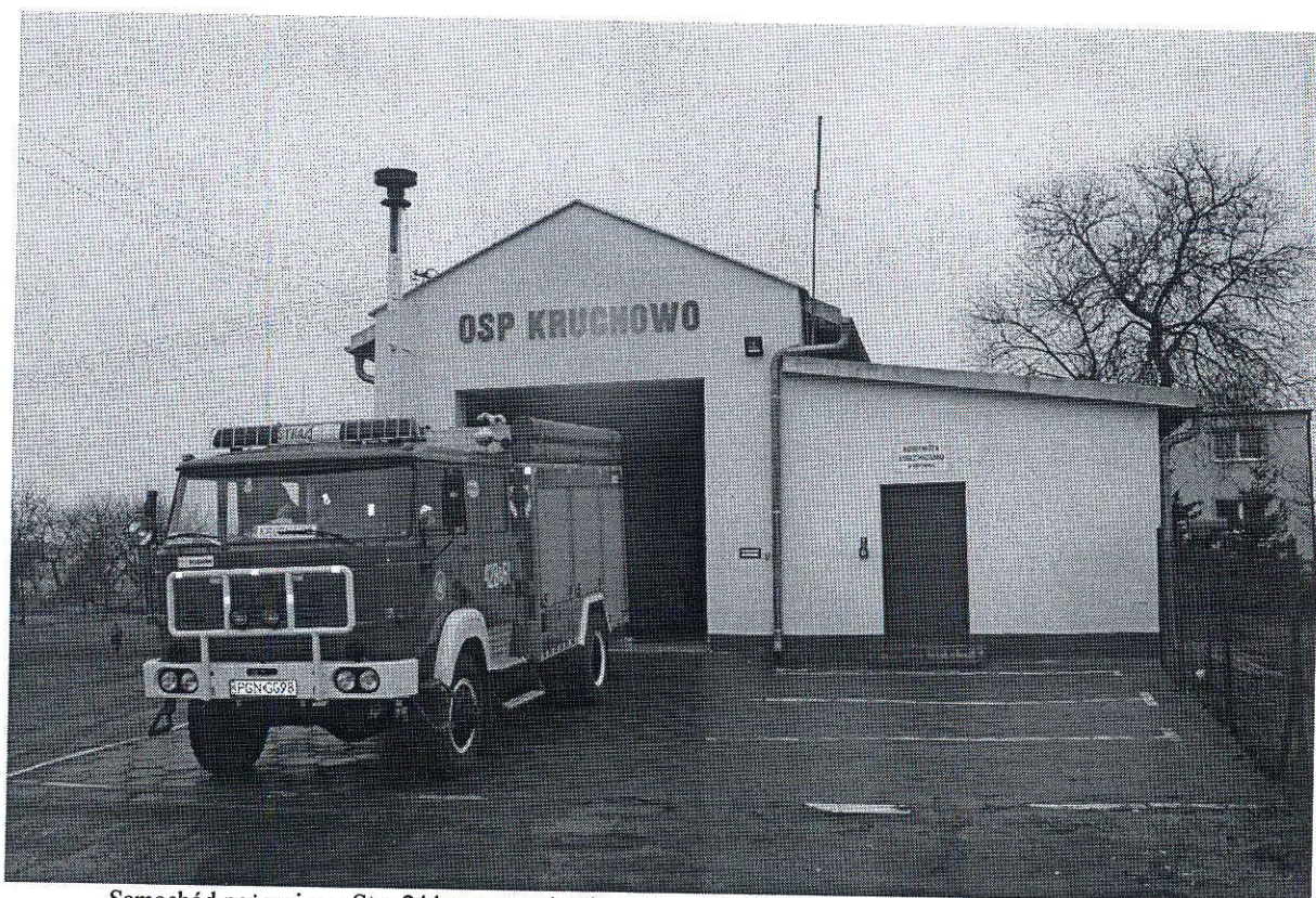
Samochód pożarniczy Star 244 oraz zmodernizowana remiza OSP w Kruchowie.

Oddziału Miejsko- Gminnego Związku OSP RP w Trzemesznie dotycząca realizacji zadań z zakresu ochrony przeciwpożarowej na terenie Gminy Trzemeszno ( miasto i gmina) w roku 2015 na sesję Rady Miejskiej Trzemeszna w dniu 30 marca 2016 r.