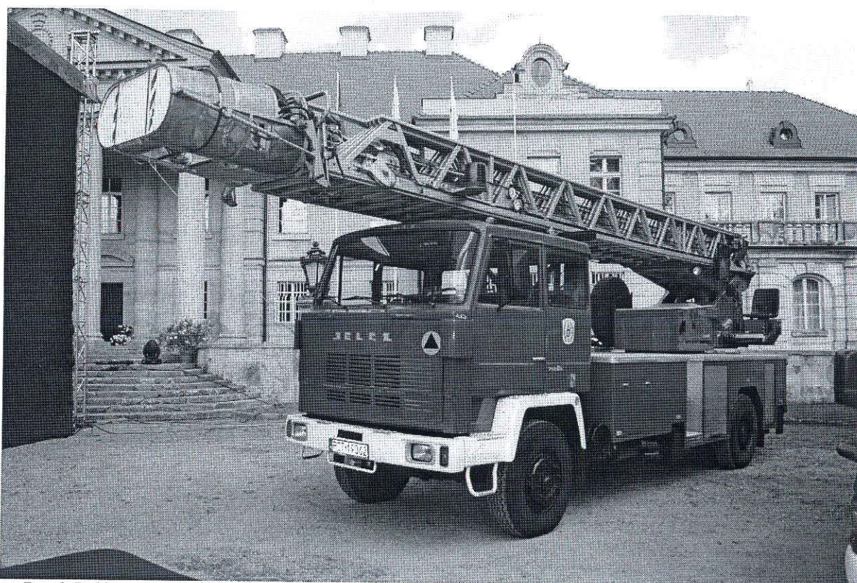
Foto. 2 Drabina samochodowa SD 37 Jelcz Magirus, która miała trafić na wyposażenie OSP w Trzemesznie.

– OSP Trzemeszno – finansowano zatrudnienie konserwatora sprzętu, palacza centralnego ogrzewania na sezon grzewczy, zakup opału, paliwa, ubezpieczenia pojazdów i strażaków itp. Zakupiono m. in. środek owadobójczy na agresywne owady błonkoskrzydłe, wyremontowano toaletę męską wraz z prysznicem, zakupiono mundury koszarowe oraz buty do mundurów, przeszkolono 4 druhów na kursie Kwalifikowanej Pierwszej Pomocy medycznej, wykonano bieżące badania lekarskie kierowców OSP oraz druhów biorących udział w działaniach ratowniczych, przeprowadzono bieżące remonty pojazdów pożarniczych, zamontowano hak holowniczy do samochodu bojowego Star 244, zamontowano nowy system do mocowania rękawic przy kombinezonie do pracy w wodzie.