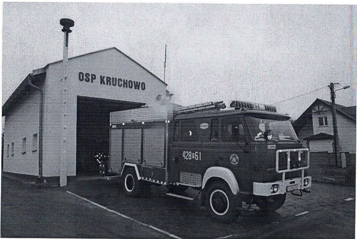
Foto. 9. Wóz bojowy OSP Kruchowo, przekazany w roku 2014 z OSP w Trzemesznie