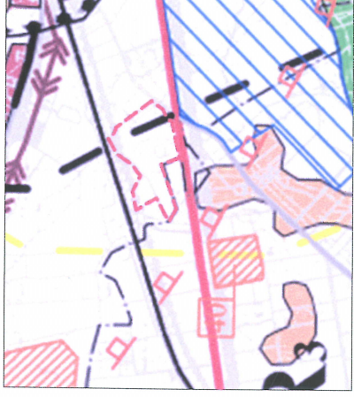
R.1-3 teren rolniczy w strefie C-R2 graniczna linia planu