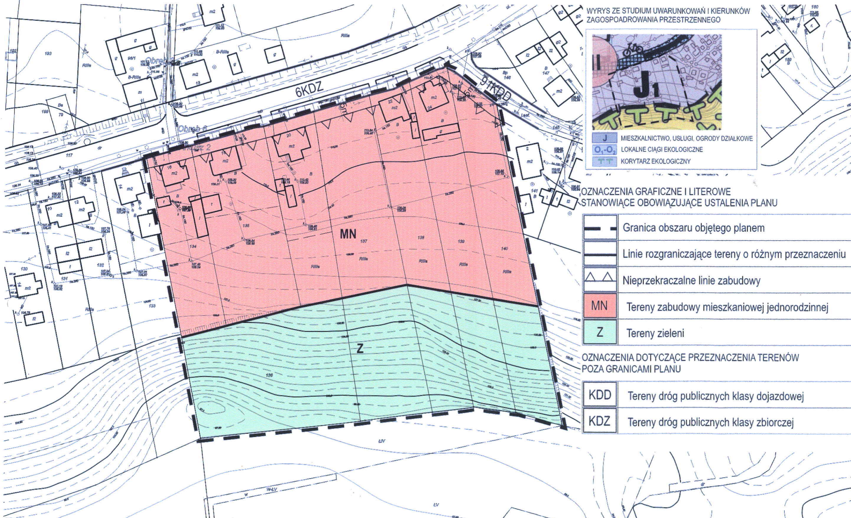
WYRYS ZE STUDIUM UWARUNKOWAŃ I KIERUNKÓW ZAGOSPODAROWANIA PRZESTRZENNEGO